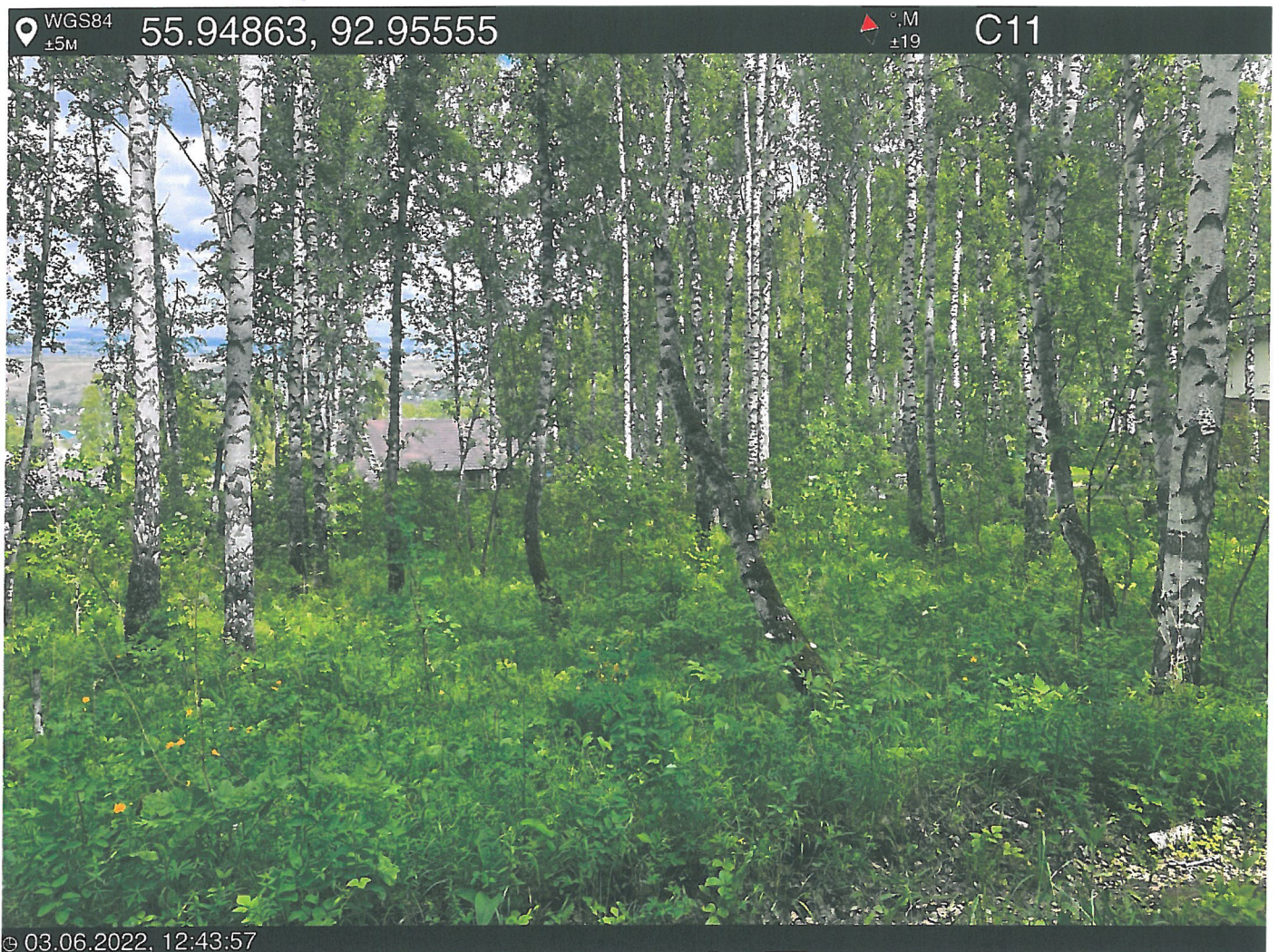
Фото – отчет о выполнении работ по проведении лесопатологического обследования в 2022 году. Лесных насаждений Городского лесничества г. Красноярск, Красноярский край(субъект РФ) Базайское участковое лесничество Квартал 30 выдел 39, площадь выдела 3,6 га.

Исполнитель работ по проведению лесопатологического обследования: